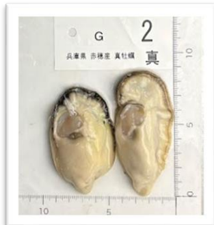
あこう 兵庫県赤穂産 ●重さ 64g ●身の重さ 19g ●縦9cm ●横5cm