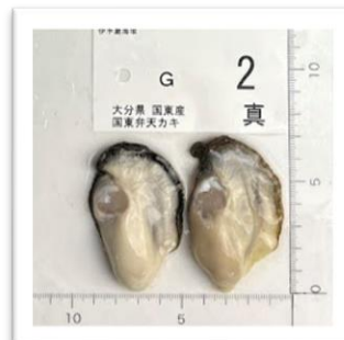
くにさき くにさきべんてん 大分県国東産“国東弁天カキ” ●重さ 66g ●身の重さ 16g ●縦8.5cm ■横5cm