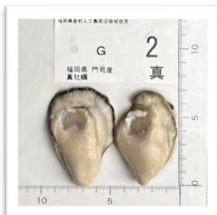
もじ ぶぜんかいひとつぶ 福岡県門司産“豊前海一粒かき” ●重さ 63g ●身の重さ 18g ●縦7.7cm ●横5.7cm