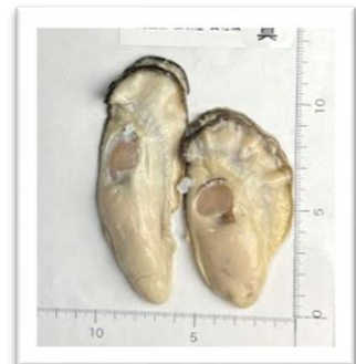
むしあげ 岡山県虫明産 “虫明ヴィーナスオイスター” ●重さ 100g ●身の重さ 25g ●縦11.7cm ●横5.3cm