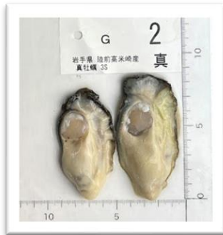
よねさき 岩手県米崎産 3Sサイズ ●重さ 113g ●身の重さ 15g ●縦10cm ●横6cm