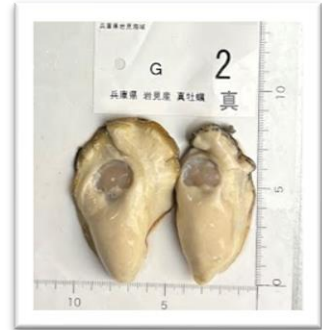
いわみ しばたのかき 兵庫県岩見産“柴田ノ牡蠣” ●重さ 87g ●身の重さ 26g ●縦9.7cm ●横5cm