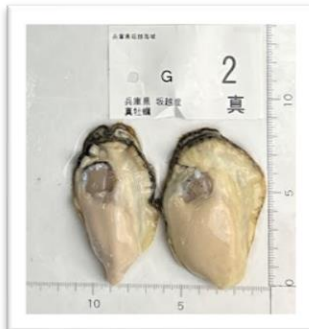
さこし はりまなだのいちねんがき 兵庫県坂越産“播磨灘の一年牡蠣” ●重さ 87g ●身の重さ 26g ●縦9.3cm ●横6cm